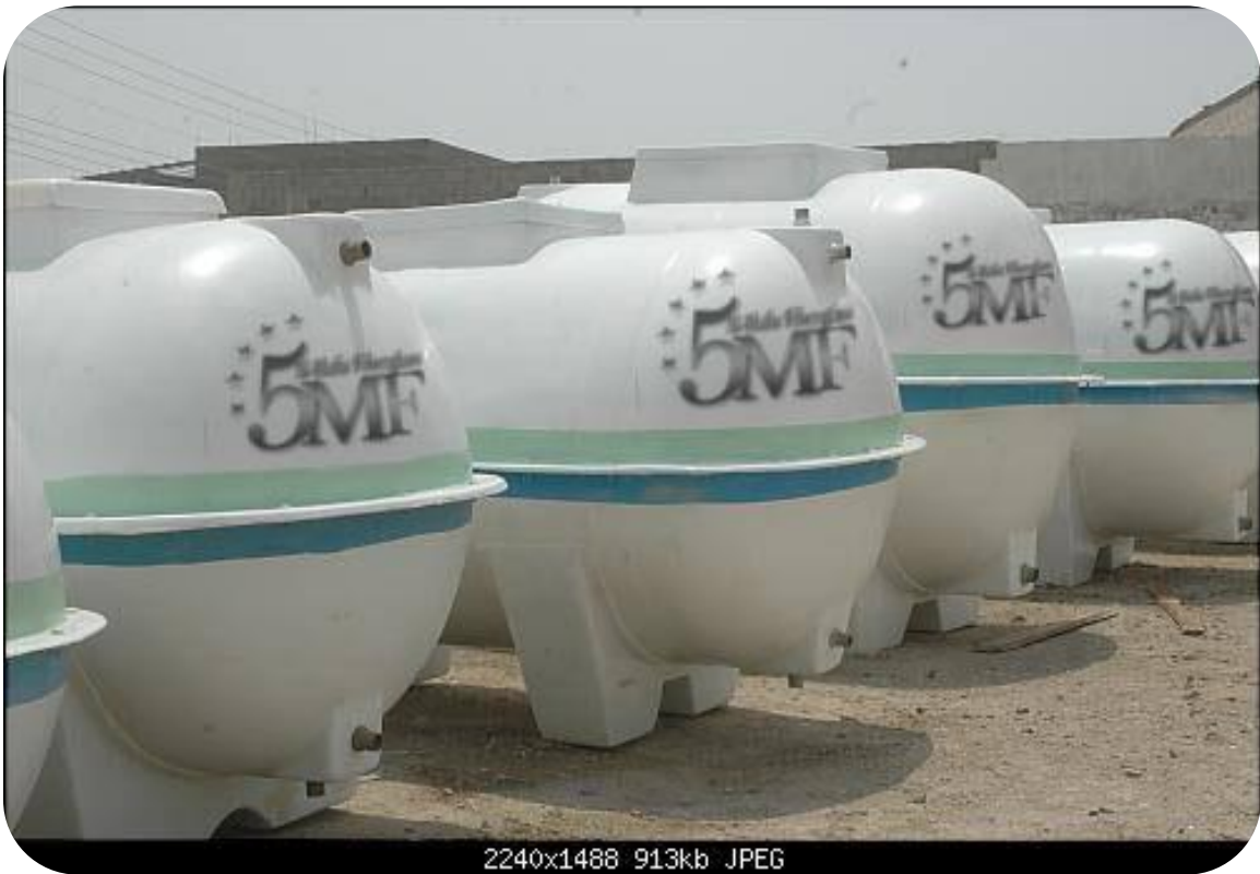
2240x1488 913kb JPEG 5540x1488 813kb JPEG